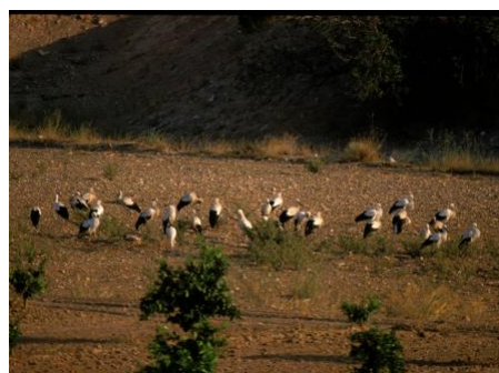
Cigognes en hivernage en Espagne.

Les cigognes qui migrent au Sud en empruntant la route occidentale n'hivernent pas toutes dans la même région. Autrefois, la majorité d'entre elles allaient jusqu'au Sahel, au sud du Sahara. Elles passaient l'hiver entre la Mauritanie et le Niger. Aujourd'hui, nombre d'entre elles s'arrêtent sur la péninsule ibérique ou au Maroc. Les décharges à ciel ouvert leur fournissent une nourriture abondante (cf. En savoir plus, M12).