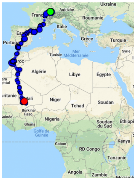
Trajet de migration d'une cigogne depuis la Suisse par la route de l'Ouest.