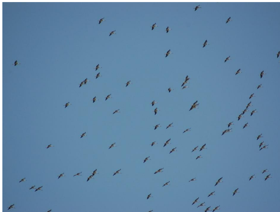
Un groupe de cigognes migre en vol plané.

La plupart des cigognes blanches atteignent leur site d'hivernage entre septembre et octobre. Durant près de 5 mois, elles flânent aux alentours en quête de nourriture et parcourent des centaines parfois des milliers de kilomètres. En mars débutent les retours en direction du nid de naissance, c'est la "migration printanière".