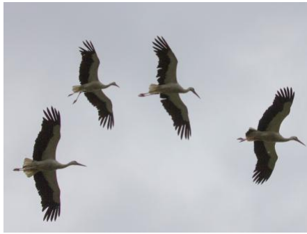
Cigognes aux jambes inclinées, en manoeuvre d'atterrissage.