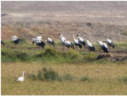
Une troupe de cigognes au repos.

du Sahel. Elles s'arrêtent plus longuement au Soudan, au Tchad et en Ethiopie. Elles y capturent de grandes quantités d'insectes, en particulier des sauterelles. Quand la nourriture se fait rare, avec l'arrivée de la saison sèche, plusieurs d'entre elles repartent vers l'Afrique de l'Est et du Sud. Là, elles jouissent à nouveau des ressources alimentaires abondantes qui succèdent à la saison des pluies.