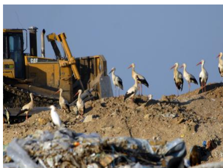
La plupart des cigognes hivernent maintenant sur des décharges publiques.

Les chercheurs ont constaté que les cigognes qui passent l'hiver dans la péninsule ibérique ont de meilleures chances de survie. Grâce à un trajet plus court, elles utilisent moins d'énergie, sont confrontées à une quantité réduite de dangers et retournent dans l'aire de reproduction en avance et en meilleure forme physique.